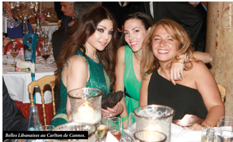
Belles Libanaises au Carlton de Cannes.