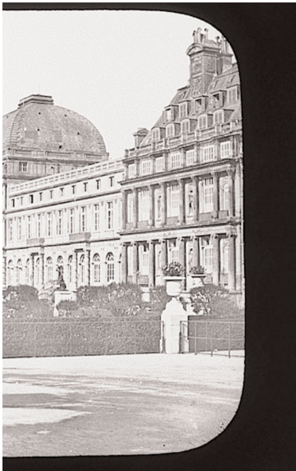
Le château des Tuileries, façade sur le jardin (photo de 1858).

taller la présidence de la République, l'avait bien compris. Jean Tulard l'envisage même comme « un acte de réconciliation nationale » !